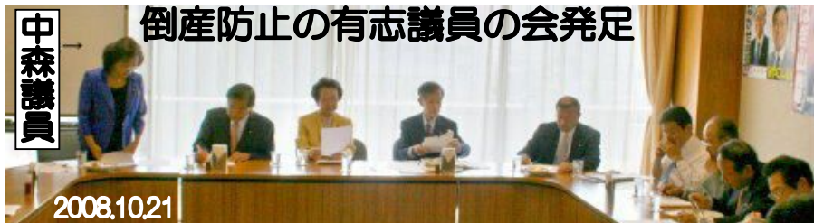
倒産防止の有志議員の会発足